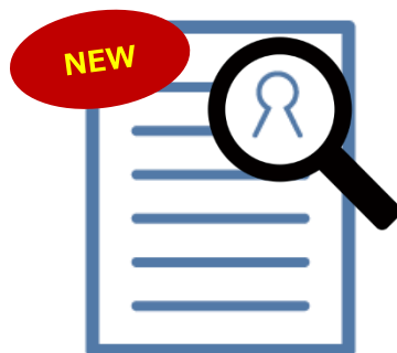
学生による ES投稿&閲覧