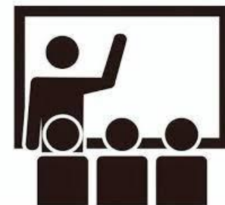
アルバイト・設計展 コンペ等の情報の掲載