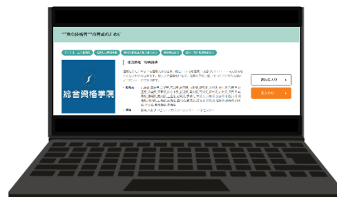
インターンシップ 本選考等の掲載